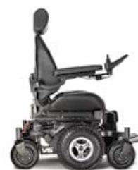
SCHWARZ - CHROMFELGEN