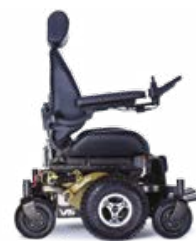
ARMEEGRÜN - CHROMFELGEN

«WIR STELLEN SEIT 25 JAHREN KUNDENSPEZIFISCH ANGEFERTIGTE ROLLSTÜHLE HER, DAMIT SIE SO LEBEN KÖNNEN, WIE SIE WOLLEN»